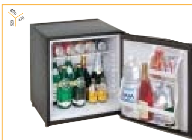
Tutti i modelli sono dotati di cerniera di traino Sliding hinge standard with the minibars