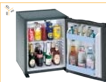
Gruppo refrigerante integrato nel mobile The cooling unit is integrated in the cabinet